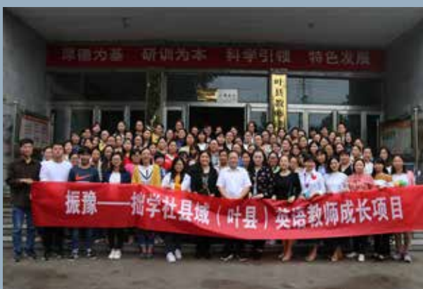
拙学社项目活动合影