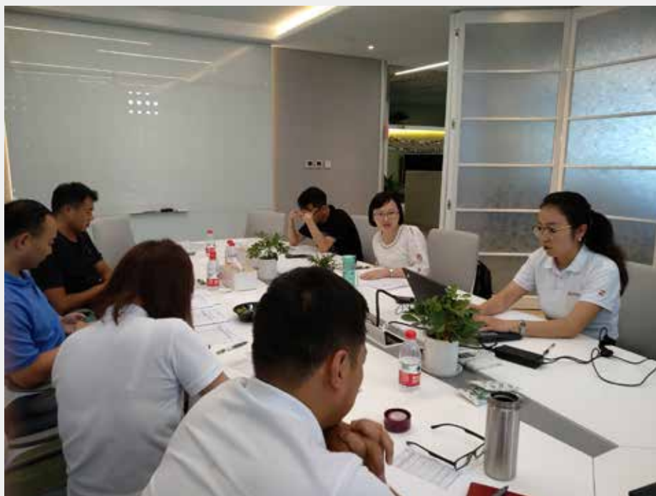
6月，材料搜集，初步审核。