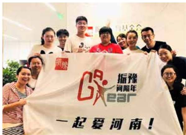
间隔年计划首期工作坊留念

振豫 - 间隔年社会实践资助计划 2018 年共资助 7 名青年进行学习提升，并在河南区域内开展项目及社会实践。截止 2018 年年底，先后共与 10 家省内外机构进行合作，累计活动天数达 210 天，开展 8 场讲座，2 场工作坊，累计收到伙伴项目方案 7 个，已推进方案 6 个，运转良好并产生了一定的社会影响力。