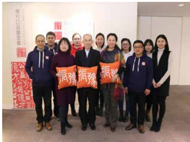
一届理事会第二次会议