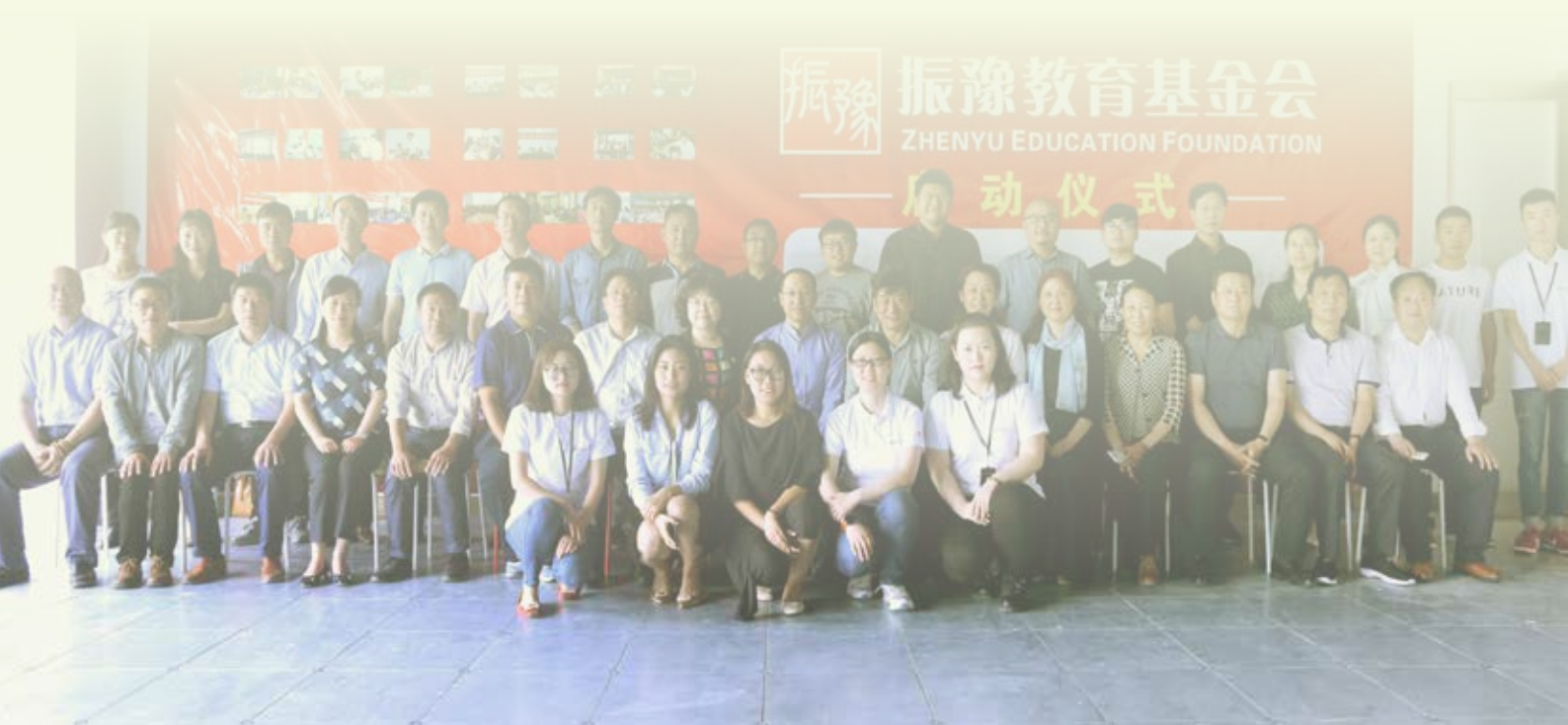
2018年5月24日，振豫教育基金会启动仪式现场