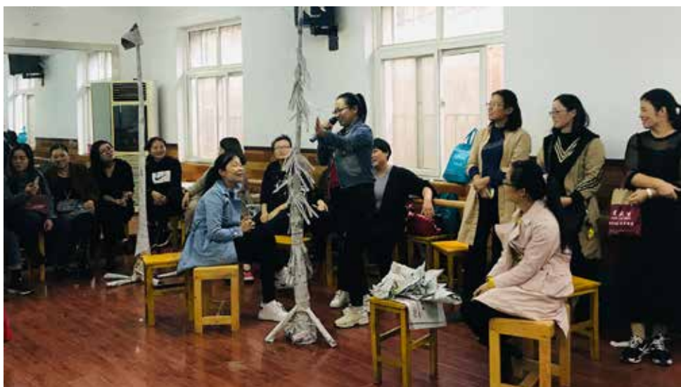
拙学社教师社群活动现场

拙学社自 2018 年 9 月正式启动以来，截止 2018 年年底，累计活动天数达 85 天，线下培训活动 12 天，共计 72 课时，参与人次共计 1047 人次；线上培训活动 9 次，课程后续累计播放次数 3802 次，进行 6 次社群活动，惠及两县共计 31 个乡镇，起步顺利，获得了较好的培训效果。