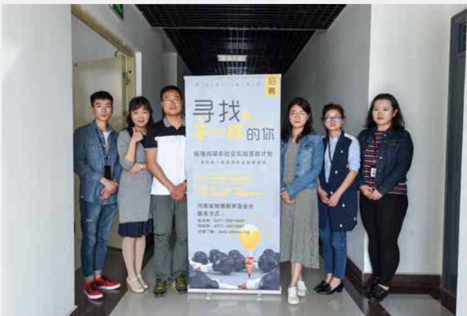
5月14日，振豫 - 间隔年计划正式招募。