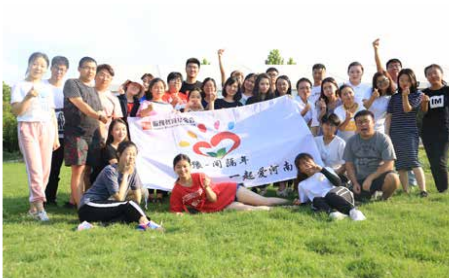
间隔年计划营地体验暨复审选拔活动

振豫 - 间隔年社会实践资助计划 2018 年共资助 7 名青年进行学习提升，并在河南区域内开展项目及社会实践。截止 2018 年年底，先后共与 10 家省内外机构进行合作，累计活动天数达 210 天，开展 8 场讲座，2 场工作坊，累计收到伙伴项目方案 7 个，已推进方案 6 个，运转良好并产生了一定的社会影响力。