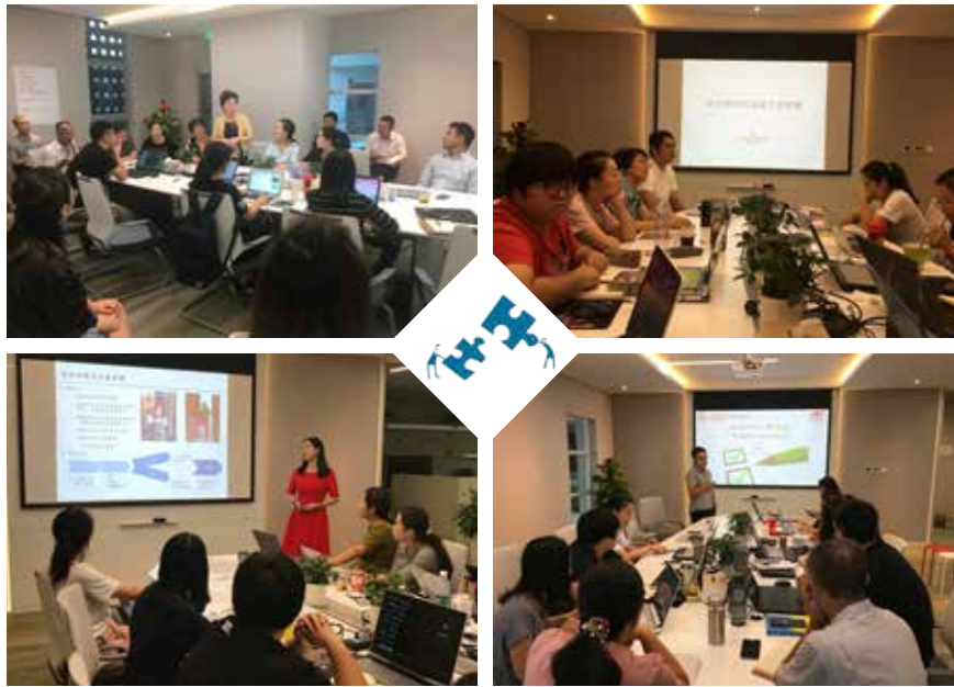
振豫 - 公益讲座现场