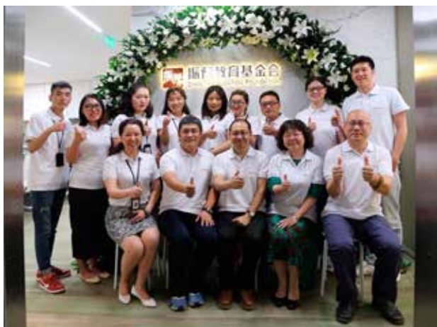
一届理事会第一次会议

基金会分别于 2018 年 5 月 23 日与 12 月 15 日，召开了一届理事会第一次和第二次会议。在一届理事会第一次会议上，与会理事听取了秘书处关于基金会前期筹备工作以及 2018 年工作计划即项目实施方案的汇报。通过了关于基金会前期项目及战略定位的相关决议。一届理事会第二次会议，通过了《关于基金会 2018 年工作报告的决议》、《关于基金会项目工作阶段计划的决议》、《关于通过 < 河南省振豫教育基金会理事会制度 > 等八项制度文本的决议》。