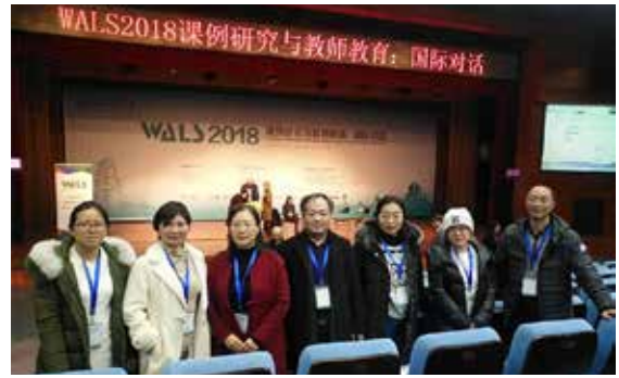
拙学社专家及地方团队成员参与大会

振豫 - 拙学社项目的专家与地方团队成员全程参与，与来自世界各地的代表共襄盛会，共同探讨如何将课例研究与教师培养及专业发展更好结合。学习借鉴各国课例的研究经验，探索适合河南地区课程改革、教师队伍建设、教育质量提升的前进方向。