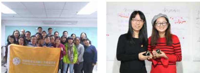
资工营培训项目现场

此外，基金会两名项目官员还参加了由新南社会组织发展中心组织的基金会资助工作者培力营培训项目，通过对社会重新认识，与理论的深度回顾，对行业的整体扫描，对问题的定向厘清来审视资助工作所需具备的能力，进而提升工作能力，在资助工作实践中不断进步。