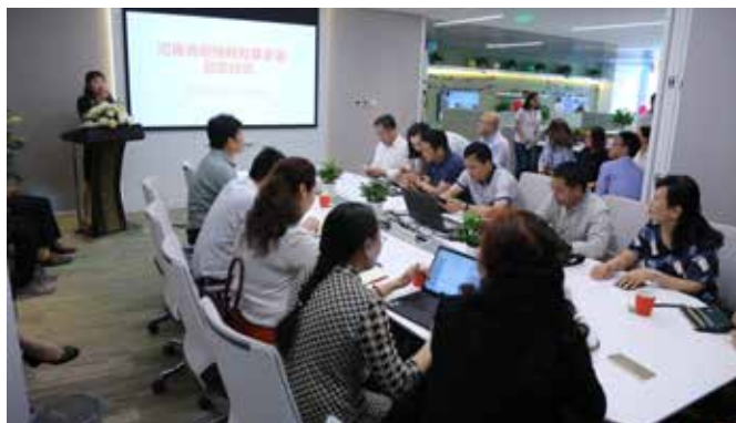
振豫教育基金会启动仪式现场

成立后不久，振豫教育基金会即着手运作经过前期调研立项的两个项目，振豫 - 拙学社县域英语教师成长项目、振豫 - 间隔年青年社会实践资助计划。2018 年全年度，公益事业总支出共计 867559.46 元。其中，运作型项目总支出占 94%，资助型项目占 6%。