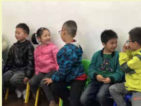
爱理思团队研课活动及儿童哲学线下课程现场。