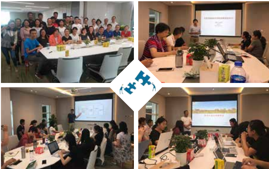
振豫 - 公益讲座汇聚我省行业伙伴，共同学习，共同成长。

截止 2018 年年底，河南公益行业从业者及各界人士共计近 300 人次参与振豫 - 公益讲座，通过这一平台，促进了我省公益行业交流，带动了行业的共同进步。