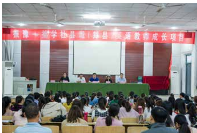
拙学社项目开班仪式

拙学社自 2018 年 9 月正式启动以来，截止 2018 年年底，累计活动天数达 85 天，线下培训活动 12 天，共计 72 课时，参与人次共计 1047 人次；线上培训活动 9 次，课程后续累计播放次数 3802 次，进行 6 次社群活动，惠及两县共计 31 个乡镇，起步顺利，获得了较好的培训效果。