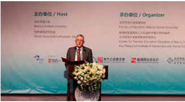
世界课例大会现场