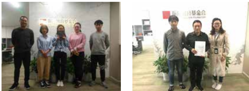
半开放的振豫 - 读书会备受团队欢迎

在运作项目的同时，基金会注重自身团队建设，协调固定学习时间，搭建行业分享、振豫读书会等学习机会，通过业界导师分享，自我学习提升激活员工学习成长内驱力，并通过定期分享交流强化学习所得，使团队整体受益，并协助省内行业共同进步。